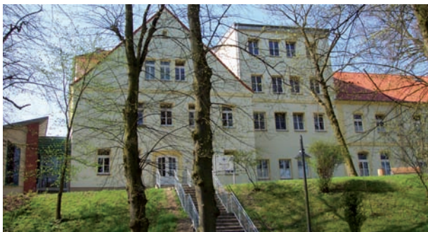
Haupteingang Stadtgarten 15

Die Klinik für Kinder- und Jugendpsychiatrie, Psychotherapie und Psychosomatik hat im Krankenhaus Röbel am 1. September 2000 ihren Betrieb aufgenommen.