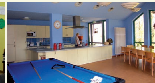
Gruppenraum der Jugendstation