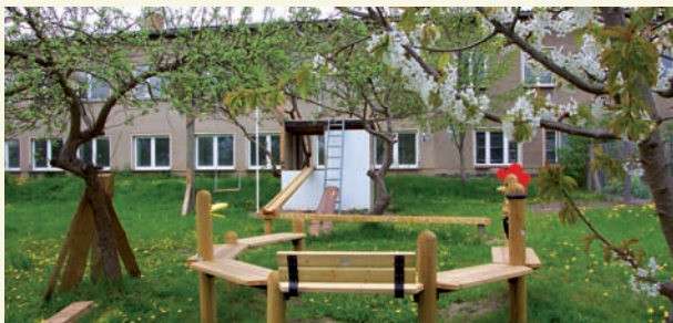
Patientengarten hinter der Schule

Außerdem ist die ambulante Diagnostik und Therapie unabhängig von einem stationären Aufenthalt möglich und es besteht die Möglichkeit zur Krisenintervention rund um die Uhr. Die Terminvergabe erfolgt nach telefonischer Anmeldung (Tel. 0 39 91/77-19 64).