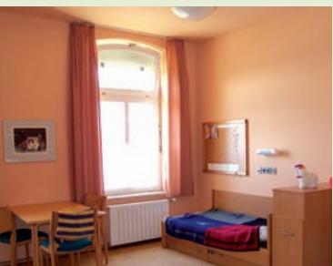
Patientenzimmer der Kinderstation